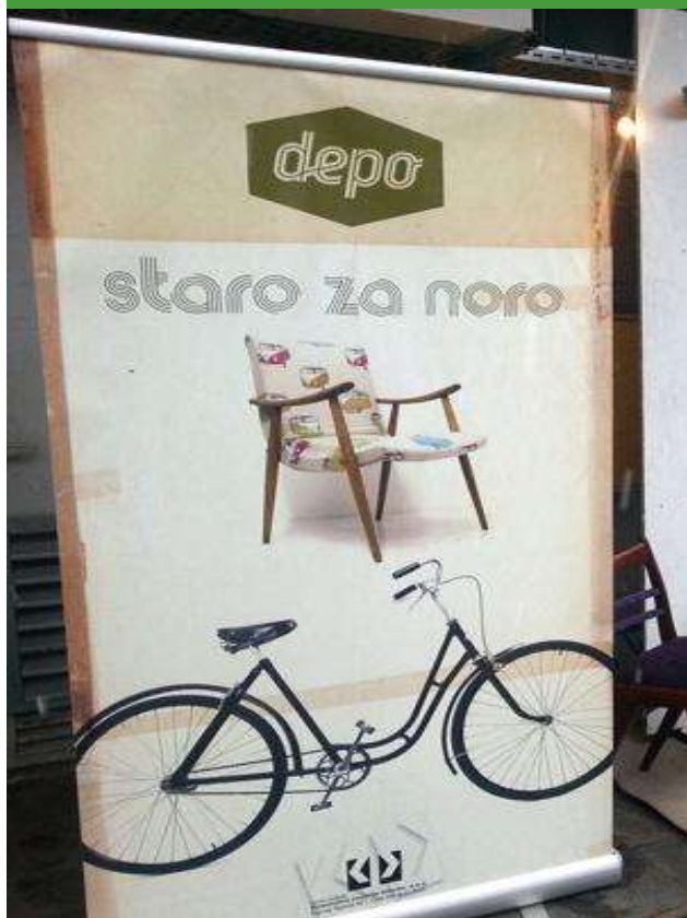
JP Komunalno podjetje Vrhnika