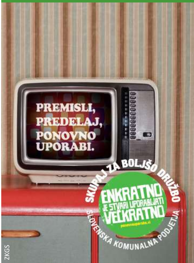
Skupaj za boljšo družbo